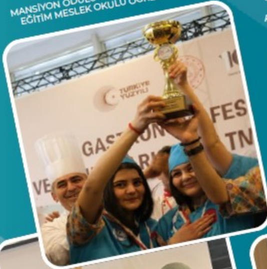
MEB GASTRONOMİ FESTİVALI VE YEMEK YARIŞMASI MANSİYON ÖDÜLÜ KONYA KARATAY ÖZEL EĞİTİM MESLEK OKULU ÖĞRENCİLERİ